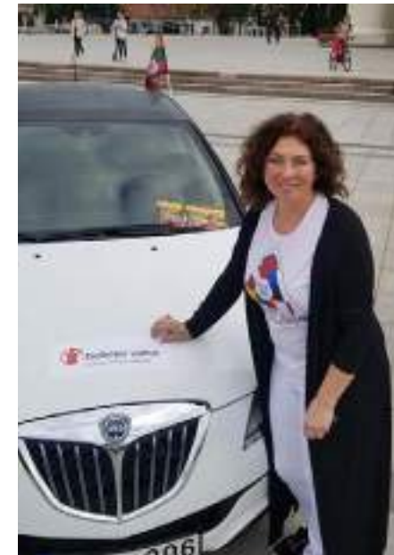
„Gelbėkit vaikus“ Baltijos kelyje minint Baltijos kelio 30-metį