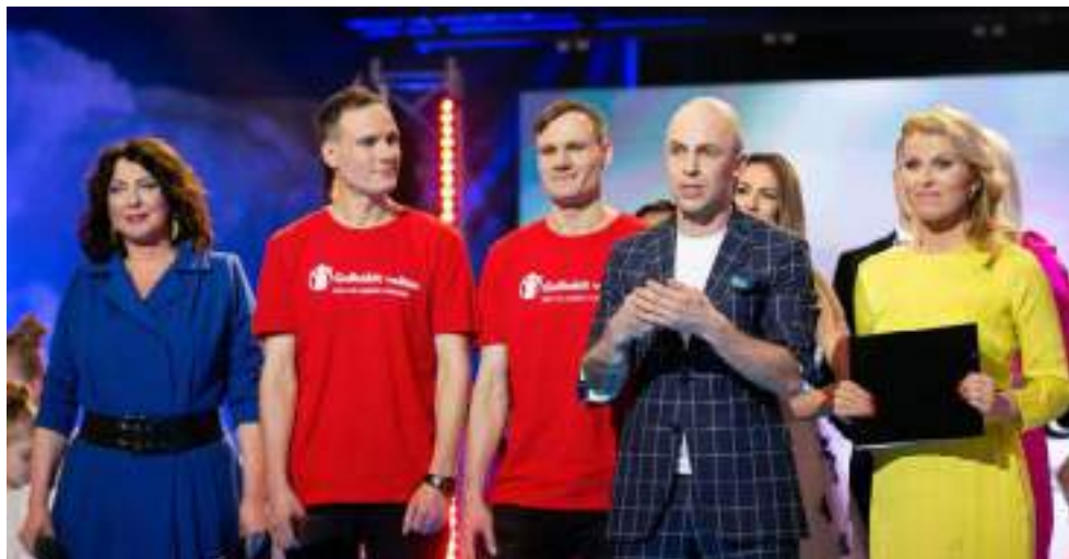
Paramos koncerto „Už vaikystę 2019“ akimirka