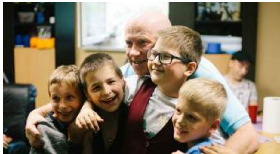
Ilgamečių rėmėjų iš Anglijos pašto vizitas